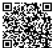
図書館カレンダー