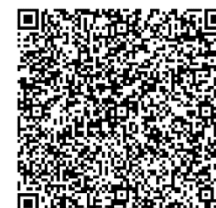
大学図書館ガイダンス 【パワーポイント】